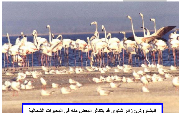
البشاروش: زائر شتوى قد يتكاثر البعض منه في البحيرات الشمالية