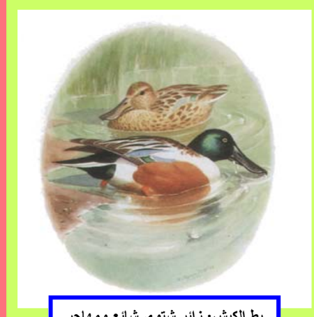
بط الكيش: زائر شتوى شائع ومهاجر