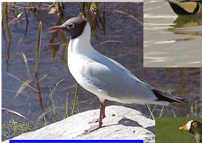
النورس أسود الرأس